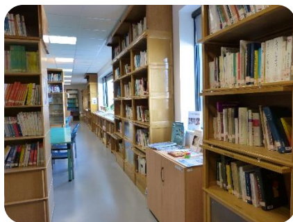
La Bibliothèque du LMA